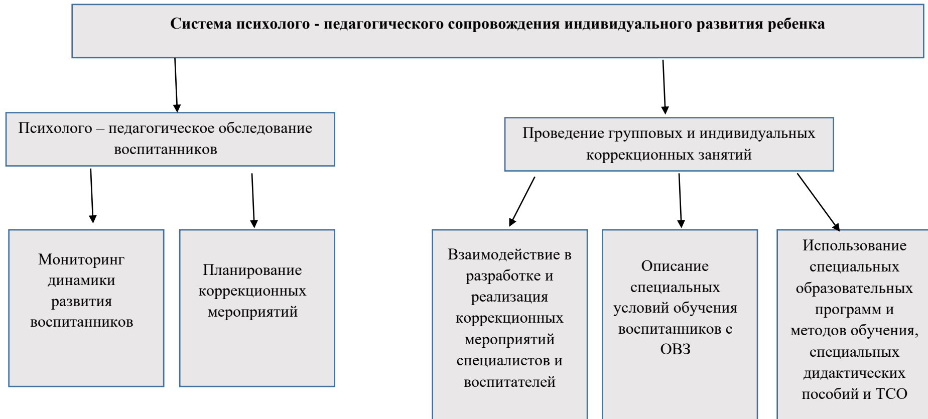
Схема 1 Система психолого - педагогического сопровождения индивидуального развития ребенка